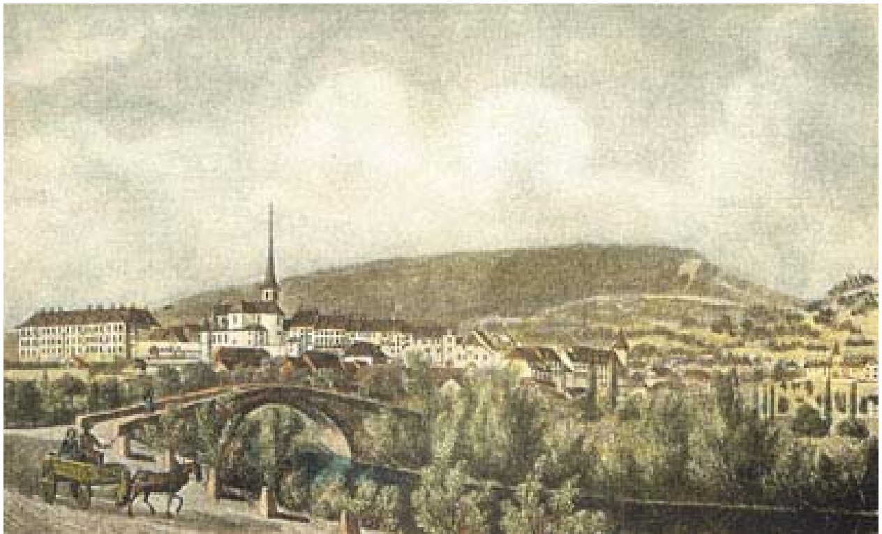
Delémont dans la première moitié du XIXe siècle

Bulletin du Cercle généalogique de l'ancien Evêché de Bâle