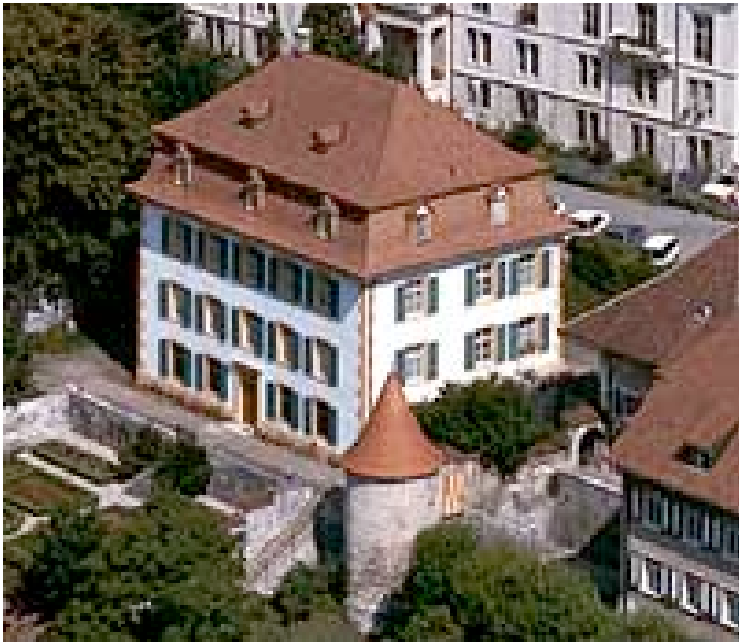
Moutier: l'ancienne demeure du prévôt de Moutier-Grandval, reconstruite au XVIIIe s. Depuis 1817, résidence du grand bailli, puis du préfet

Bulletin du Cercle généalogique de l'ancien Evêché de Bâle