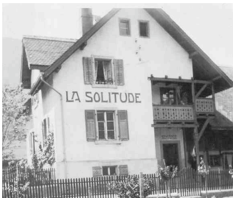
La Solitude, la maison d'habitation vers 1930.