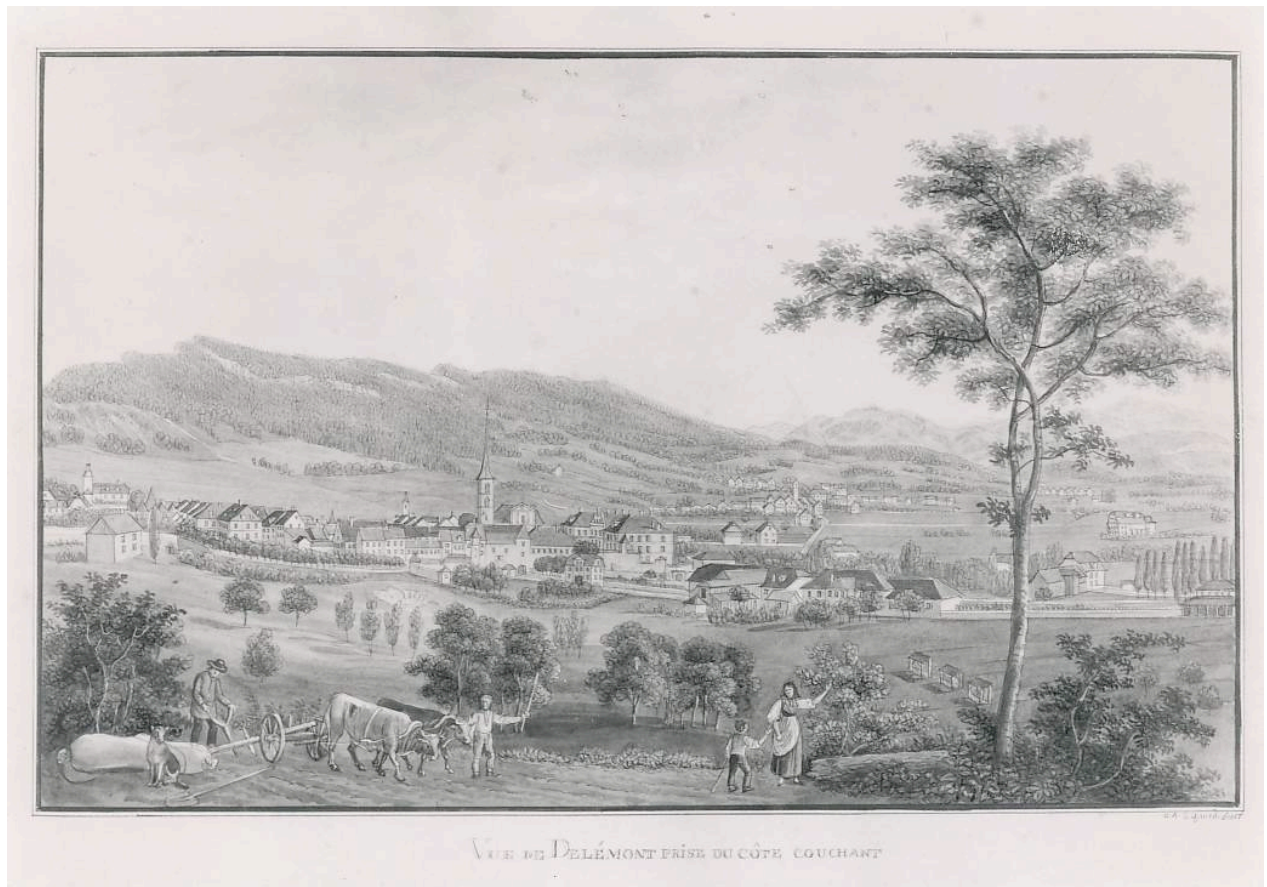
Vue de Delémont prise du côté couchant, par D. A. Schmid (environ 1840)

Bulletin du Cercle généalogique de l'ancien Evêché de Bâle