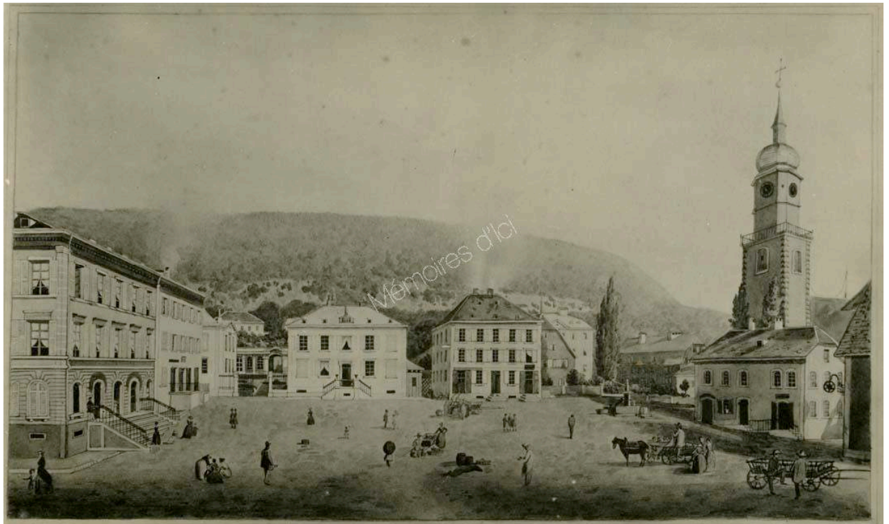
Saint-Imier : Place du Marché, 1845

Bulletin du Cercle généalogique de l'ancien Evêché de Bâle