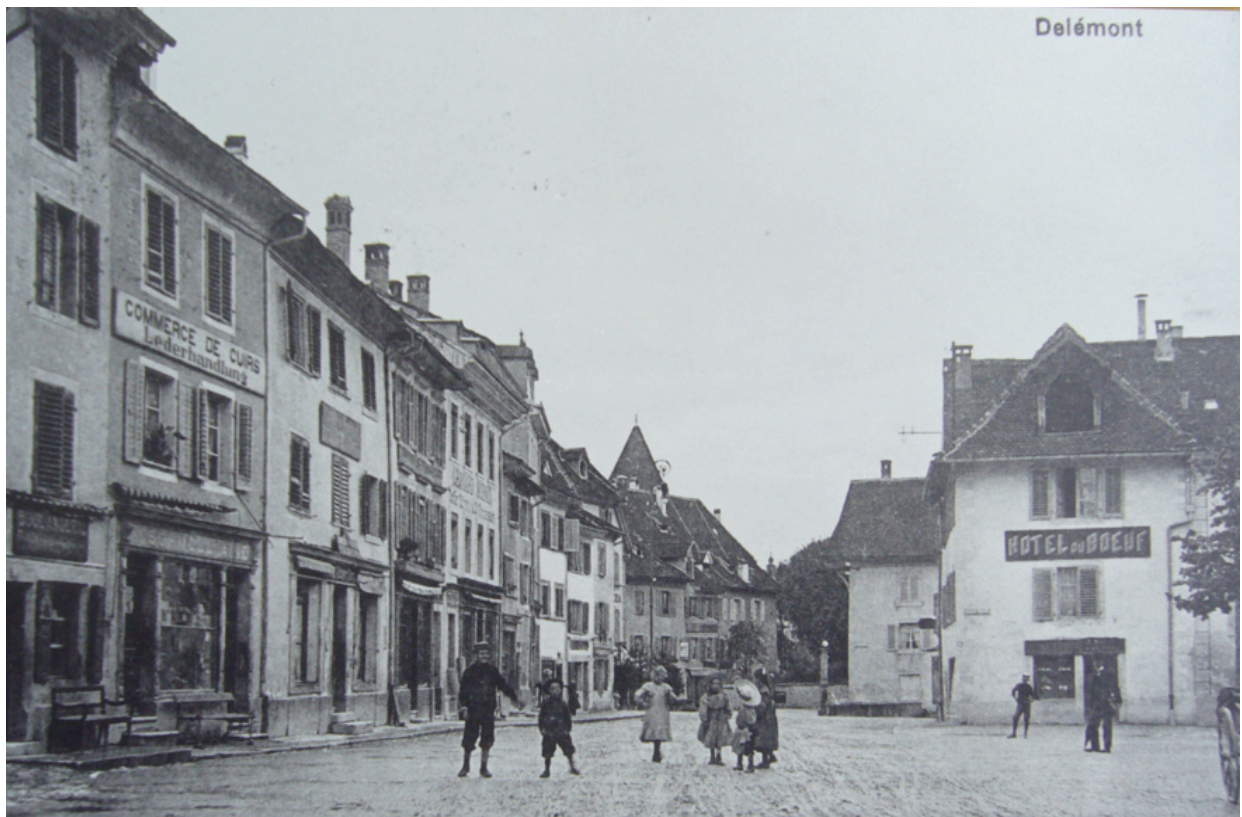
Delémont vers 1900 : la rue de l'Hôpital

Bulletin du Cercle généalogique de l'ancien Evêché de Bâle