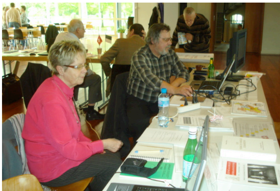
Le stand du CGAEB à la Rencontre généalogique «Tous cousins» le 21 avril à Chêne-Bougeries