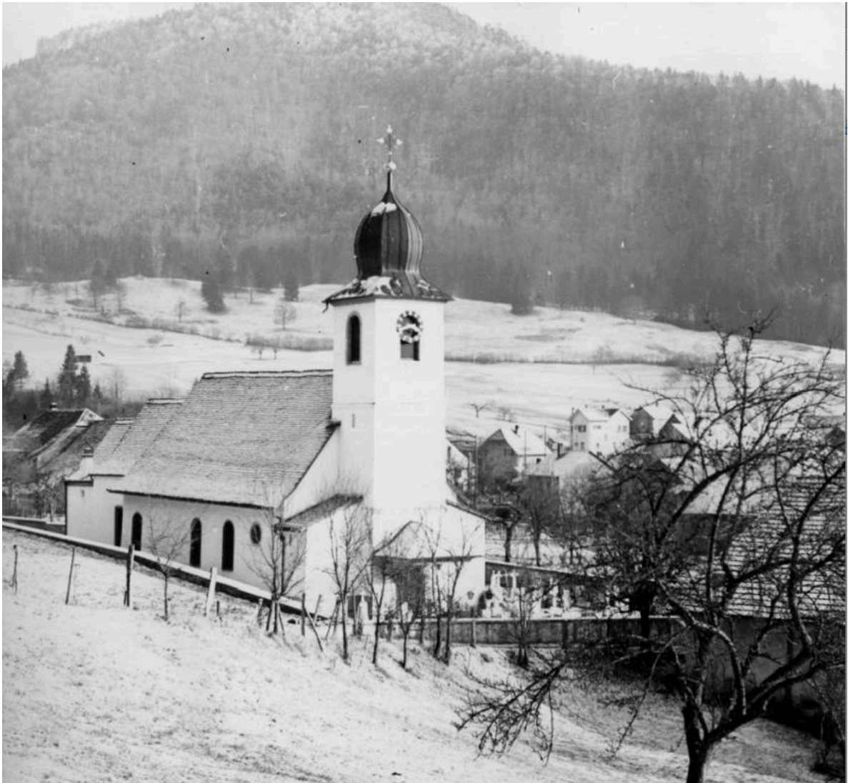
L'église de Vermes, village d'origine de la famille Monnerat émigrée à Nova Friburgo

Bulletin du Cercle généalogique de l'ancien Evêché de Bâle