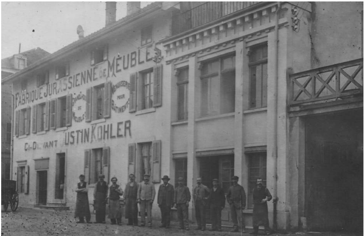
La Fabrique jurassienne de meubles, fondée en 1884 par Justin Kohler, de Liesberg, située à la rue des Texerans à Delémont (vers 1905).

Bulletin du Cercle généalogique de l'ancien Evêché de Bâle