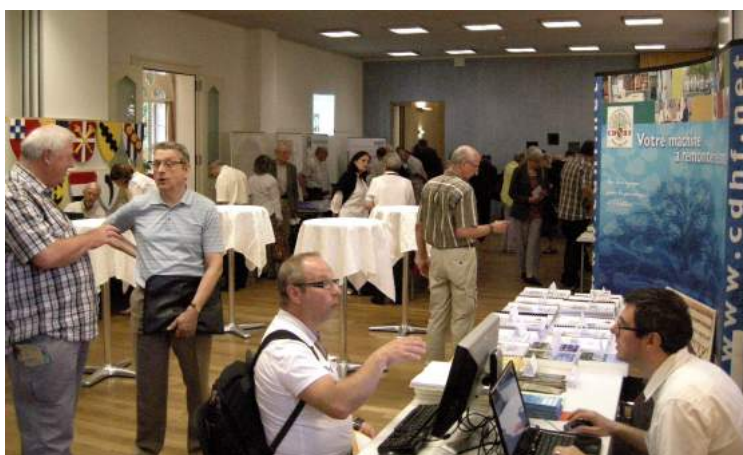
La salle d'exposition vue du stand du CGAEB