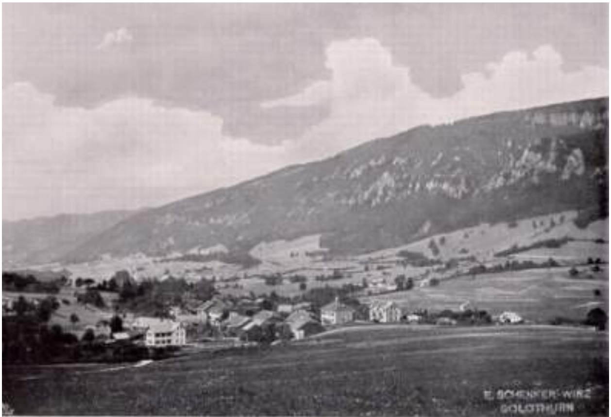
Crémines, village du Grandval ou Cornet au pied du Raimeux, lieu d'origine de la famille Gobat.

Bulletin du Cercle généalogique de l'ancien Evêché de Bâle