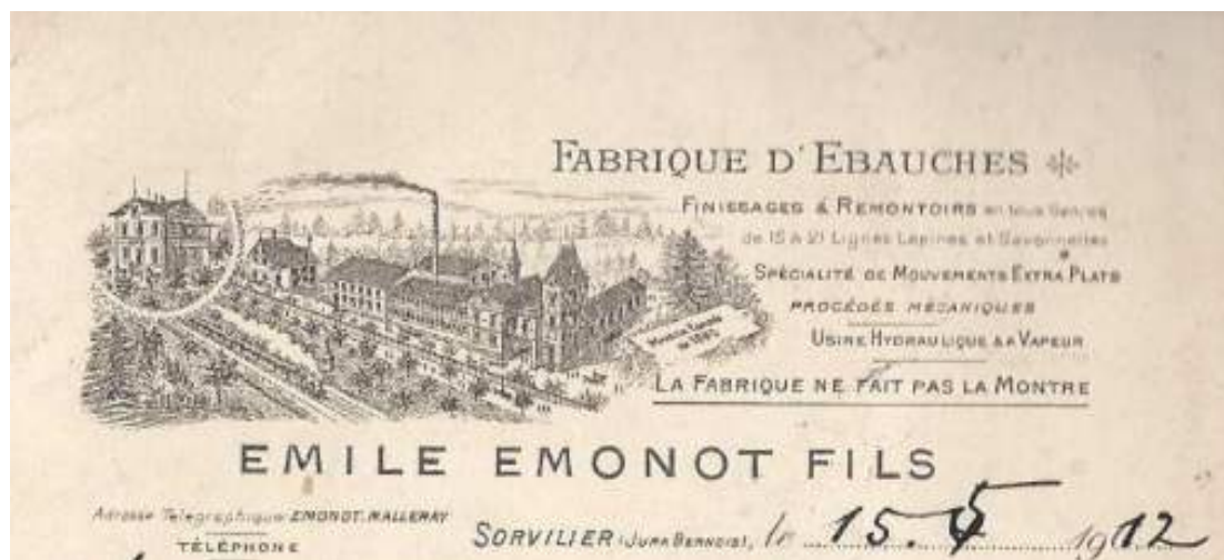
Vue publicitaire de la fabrique d'ébauches Emile Emonot à Sorvilier

11 GROSBETI Marie Madeleine, N : 22/06/1772 Étupes (F 25), D : 17/07/1840 Bart (F 25)