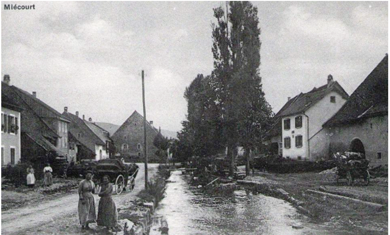
Miécourt, village d'origine de Joseph Bonvallat, mort au service du roi de France en 1748.

Bulletin du Cercle généalogique de l'ancien Evêché de Bâle