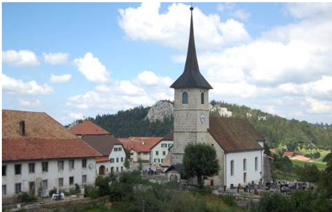
L'église de Saint-Brais, dédiée à saint Brice, reconstruite en 1656, puis 1765 et rénovée en 1965. En 1831, elle a reçu des reliques de saint Aurèle, martyr romain, patron secondaire de la paroisse.