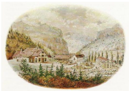
Haut fourneau de Choindez en 1846 Urs Franz Graff.

C'est à partir des années 1860 que cette industrie entrevoit son déclin. Les causes principales sont dues principalement à l'épuisement progressif des mines. Il y a aussi la menace de la concurrence étrangère qui employait le chemin de fer nouvellement construit qui facilitait grandement le transport du minerai. Seule l'usine de Choindez a survécu jusqu'à aujourd'hui, mais s'alimentait dès lors avec du minerai étranger.