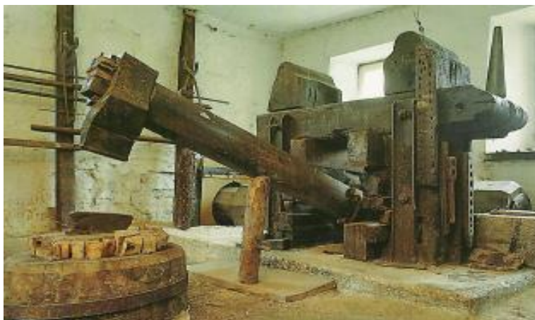
Martinet de Corcelles