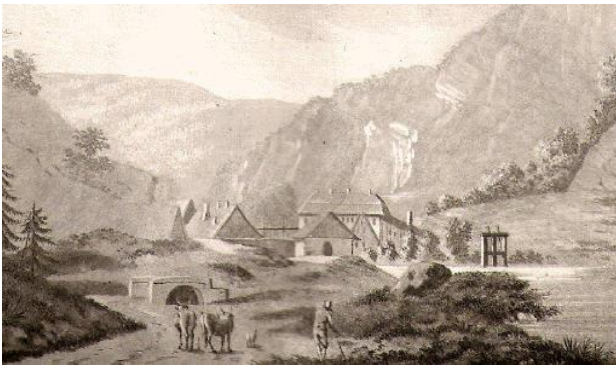
Forge d'Undervelier, Hentzy, vers 1800