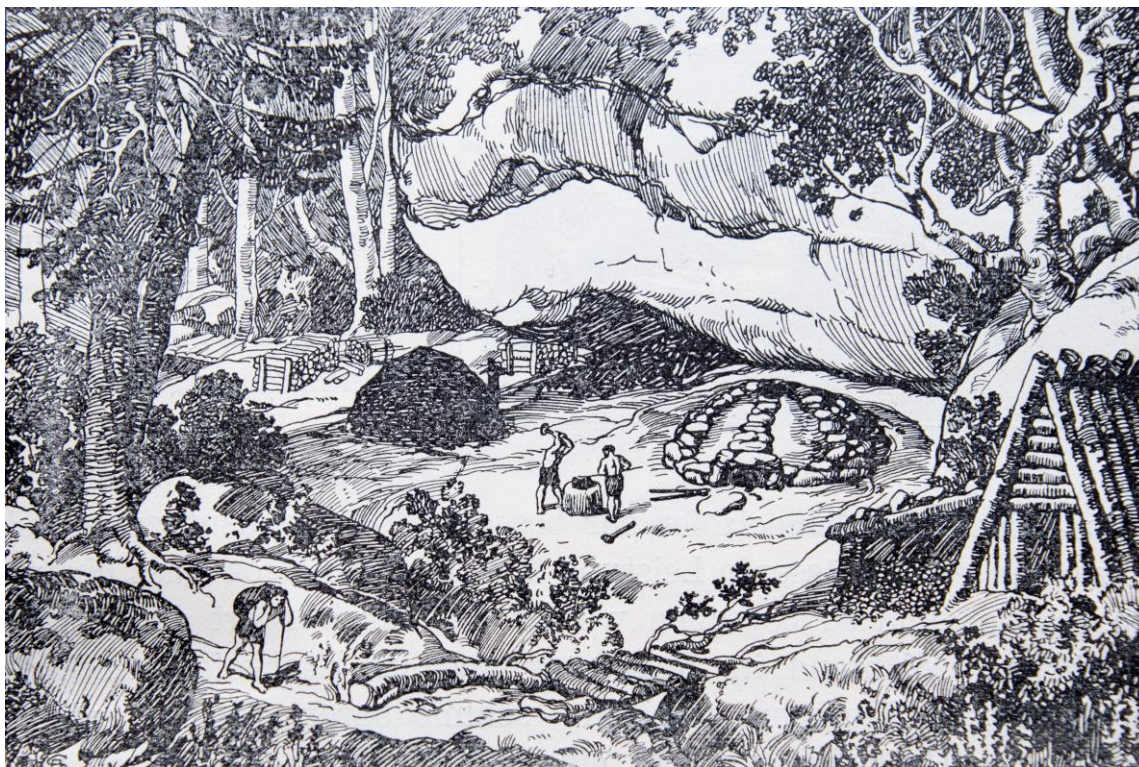
Exploitation du fer dans les temps anciens selon une gravure d'Auguste Quiquerez