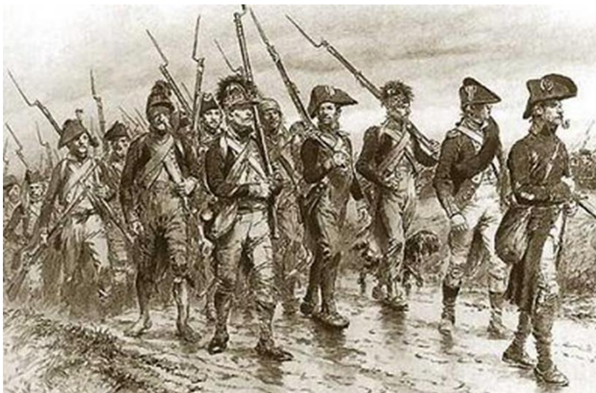
Croquis d'une unité de l'infanterie de ligne française lors des guerres révolutionnaires

Bulletin du CGAEB-Jura - Cercle généalogique de l'ancien Évêché de Bâle