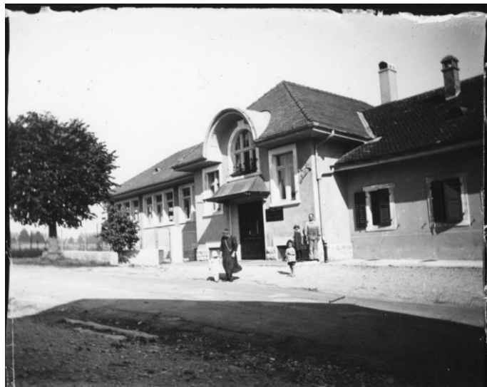
Fabrique Beaumann

- www.rudissylva.ch/histoire/industrialisation_2