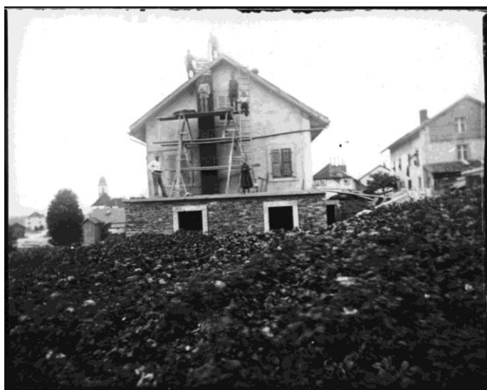
Fabrique Beaumann en construction